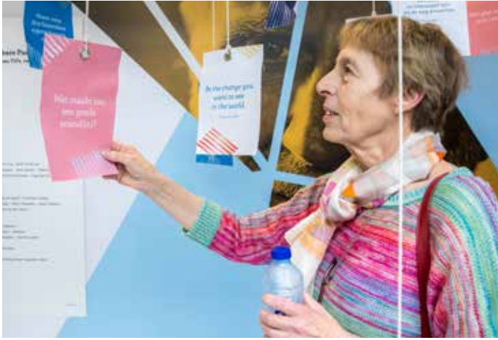
Tijdens de Parkinson Werelddag op dinsdag 11 april kwamen 120 parkinsonpatiënten samen in het UZA voor lezingen en workshops.

→ heb ik een verstandige man en kinderen.' De impact op haar gezin vindt ze een van de lastigste gevolgen van de ziekte. 'Ik was altijd de dragende kracht binnen ons gezin. Door mijn ziekte werd de grond dus ook vanonder hun voeten weggevaagd. Maar uiteindelijk zijn we er sterker uitgekomen.'